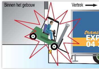
(*) Val van het platform met of zonder uitrusting