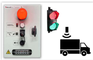
Veiligheidsbox & aanhangwagendetectie

Dankzij de risicoanalyse kunt u kiezen voor de oplossing die het beste past bij uw situatie en zo uw blootstelling aan risico's optimaal te beperken!