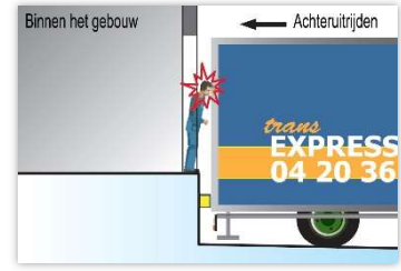
(*) Verbrijzeling van het hoofd wanneer de truck achteruitrijdt