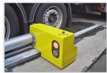
Wielkeggen met automatische positionering