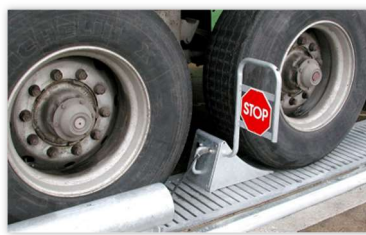
Wielkeggen met manuele positionering